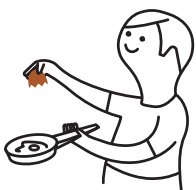
Coquilles d'œufs, de fruits de mer et fruits secs