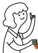
Papier de cuisine et serviettes en papier sales