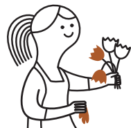
Petits déchets de jardinerie

À présent que vous séparez les fractions organiques, n'oubliez pas de :