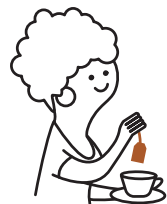
Marcs de café et d'infusions