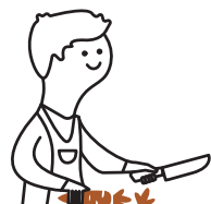
Déchets de fruits, légumes et autres aliments