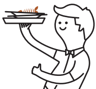
Déchets de viande et de poisson (dans des commerces/restauration lorsqu'ils sont cuisinés)