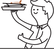
Restos de comida cocinada