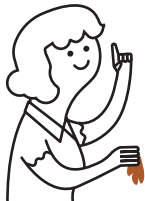
Papel de cocina y servilletas de papel usadas