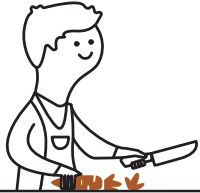
Restos de fruta y verdura