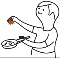
Cáscaras de huevo, de marisco y de frutos secos