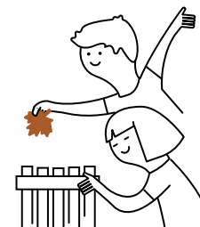
ACTIVIDAD DE APRENDIZAJE SOBRE EL COMPOST