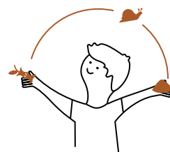
ESPECTÁCULO EDUCATIVO EN COMEDORES DE COLEGIOS