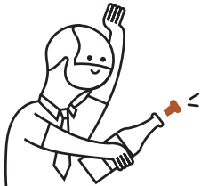
Tapones de corcho, cerillas y serrín