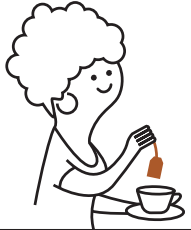
Posos de café e infusiones