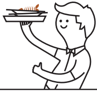
Restos de comida cocinada