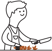
Restos de fruta y verdura