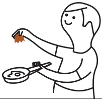
Cáscaras de huevo, de marisco y de frutos secos